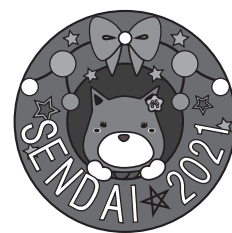
2021年度 ピンバッジデザイン