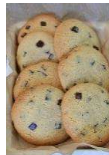
チョコレート チャンククッキー