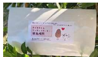
恋が生まれる アーモンドコーヒー